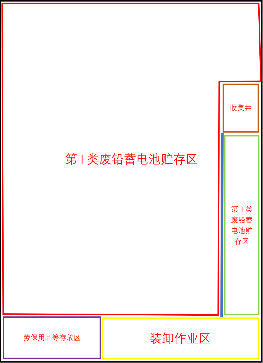
附图 2-1 平面布局图（2#、4#、5#集中转运点）