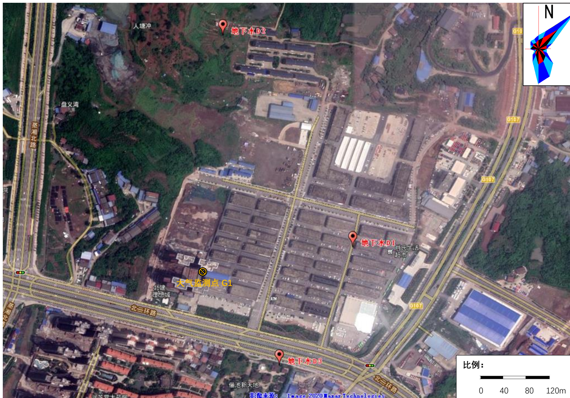
附图 3-1 大气和地下水环境监测点位图