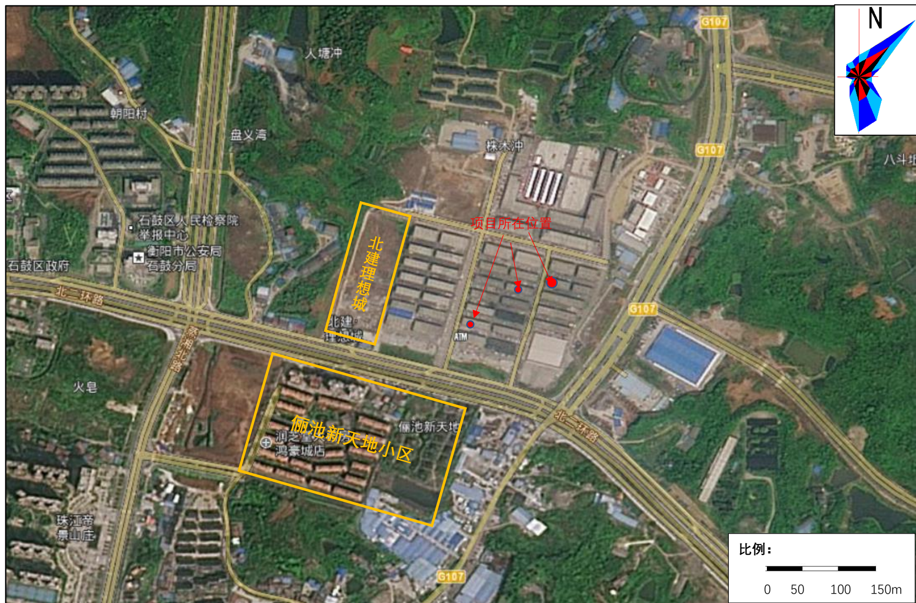
附图 4 大气环境保护目标分布图