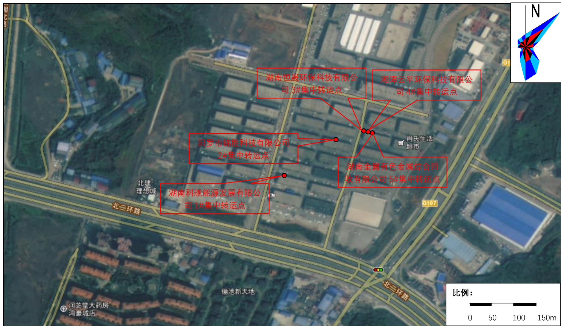
附图 1-2 项目地理位置图（各集中转运点位置）