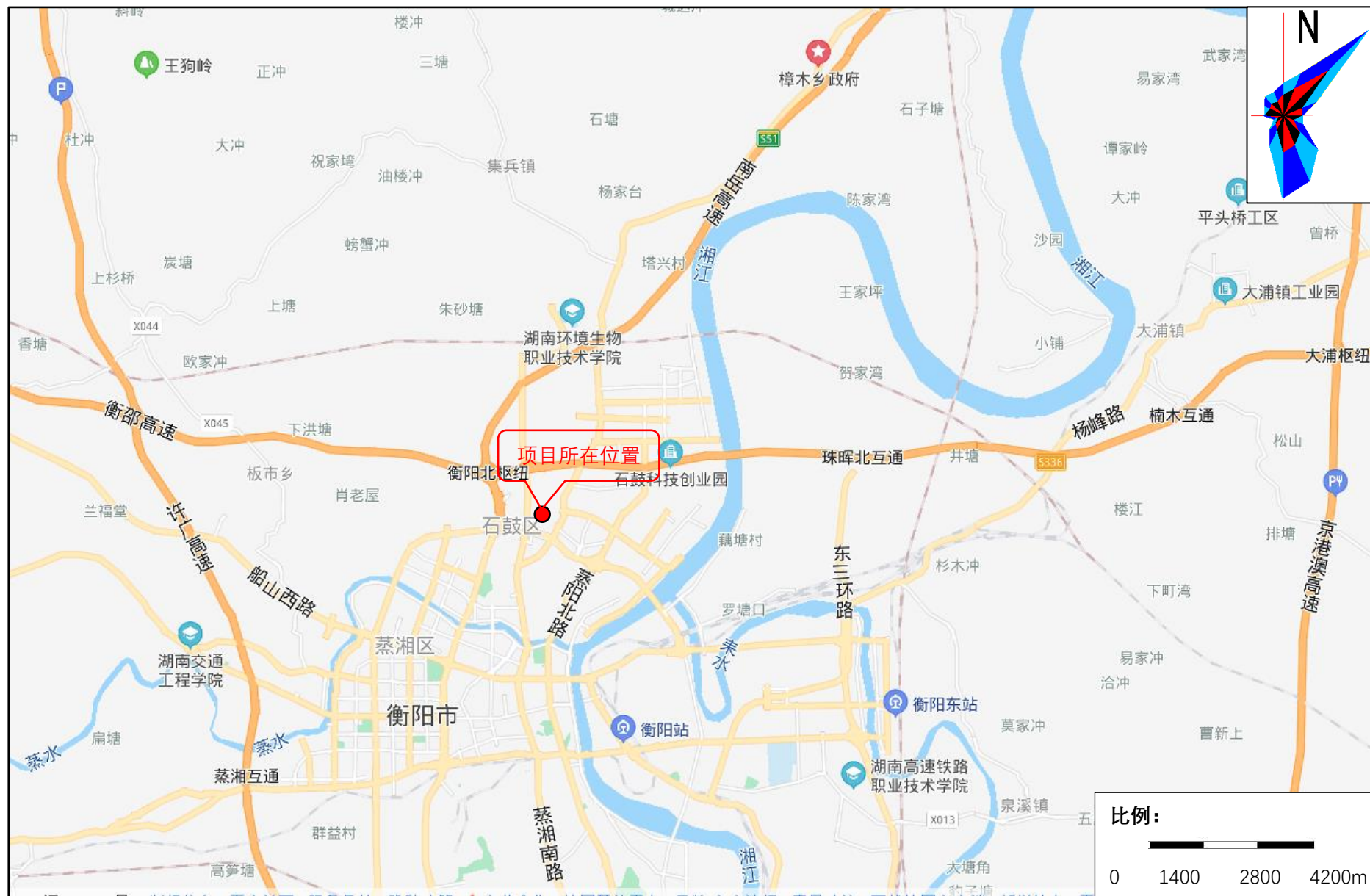
附图 1-1 项目地理位置图